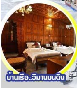
บ้านเรือ..วิมานบนดิน