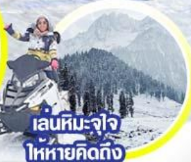
เล่นหิมะ-จ้ำจืด โหดหทัยคิดถึง